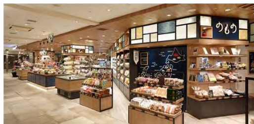
▲のもの東京駅グランスタ丸の内店