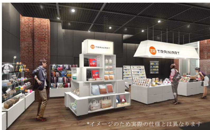
*イメージのため実際の仕様とは異なります