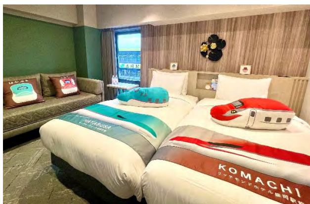
コンセプトルーム(一例)