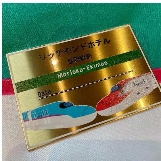
ステイメモリー銘板