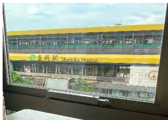
コンセプトルームからの眺望(一例)